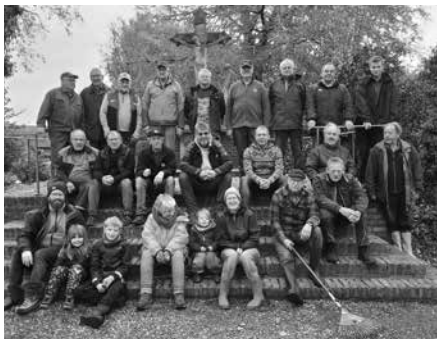
Vormittag im Park der Kapelle Klein-Jerusalem.